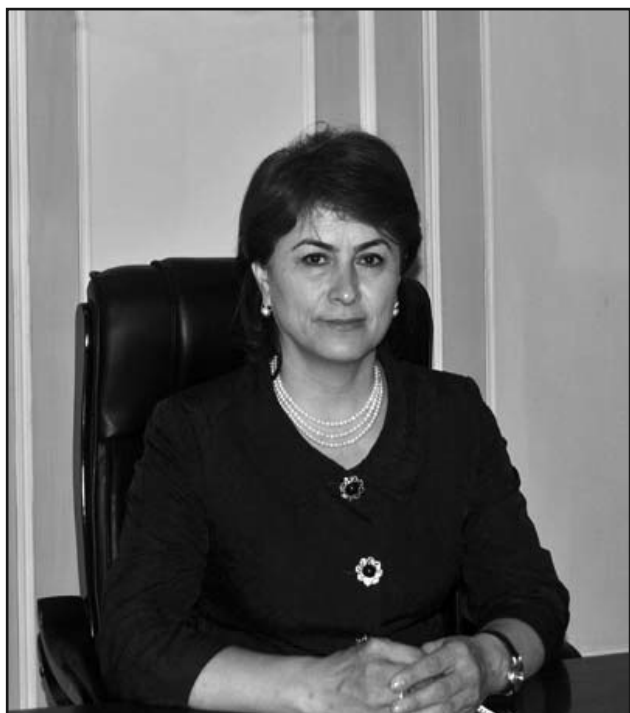
Раиси КИ ҲХДТ дар вилояти Суғд Сатториён Матлубахон АМОНЗОДА

ПАЁМИ навбатии Асосгузори сулҳу ваҳдати миллӣ – Пешвои миллат, Президенти Ҷумҳурии Тоҷикистон мӯҳтарам Эмомалӣ Раҳмон, ки санаи 26 декабр ба Маҷлиси Олии Ҷумҳурии Тоҷикистон ироа гардид, раҳнамо ва дастури муфид барои таъмини рушди устувори иқтисодиву иҷтимоӣ ва заминаи воқеӣ ба шукуфоии диёр ва фароҳам овардани зиндагии шоистаи халқ мебошад.